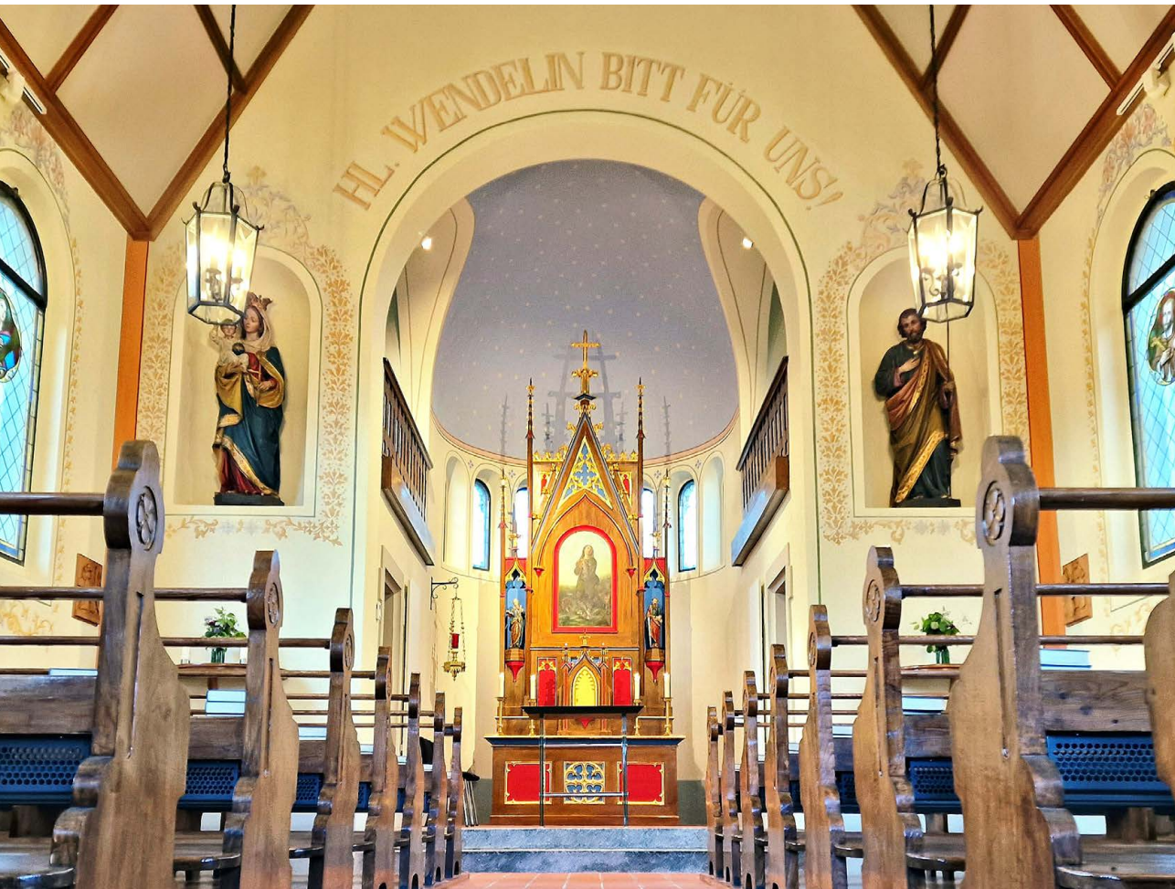
St.-Wendelins-Kapelle in Roggliswil.

17/2024 1. bis 15. Oktober Zentralredaktion