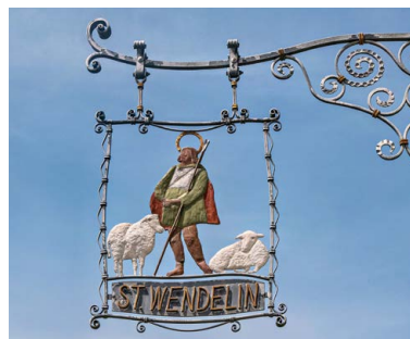
Wirtshausschild des ehemaligen Restaurants St. Wendelin in Lieli.