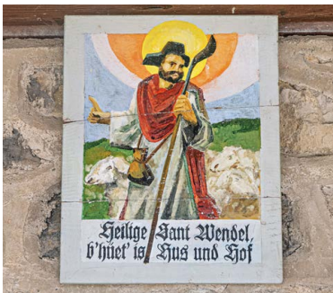
Schild an einem Stall beim Schloss Heidegg.