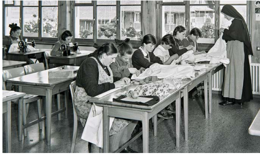
Nähunterricht der Mädchen aus dem Kinderheim Mariazell in Sursee 1955.