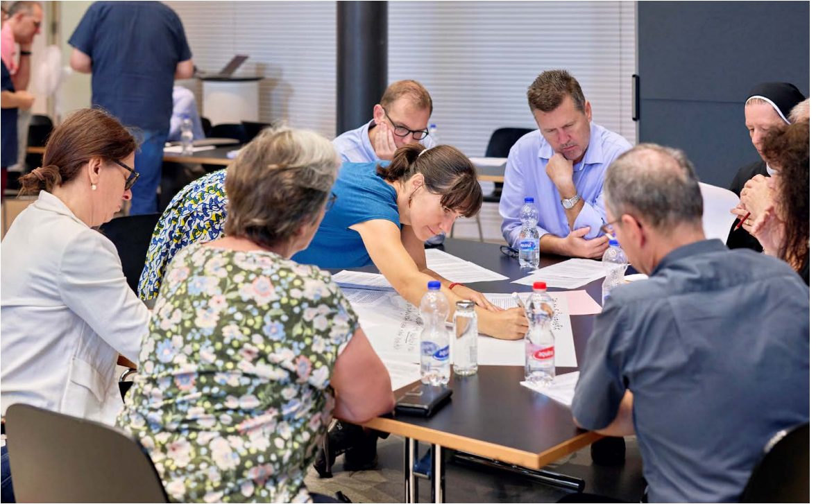
In Rom wie im Bistum Basel wird in Kleingruppen über Veränderungen in der katholischen Kirche diskutiert. Im Bild: Synodale Versammlung des Bistums Basel in Bern im Herbst 2023.