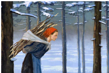
Ölgemälde «Dorothee im Wald» von Olivier Desvaux.

Bis 1.11., Museum Bruder Klaus, Dorfstr. 4, Sachseln | Öffnungszeiten und Rahmenprogramm unter museumbruderklaus.ch